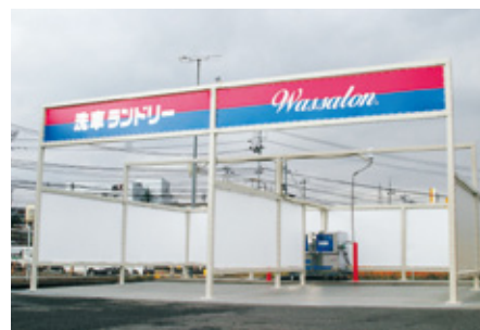
認定を受けたコイン洗車場