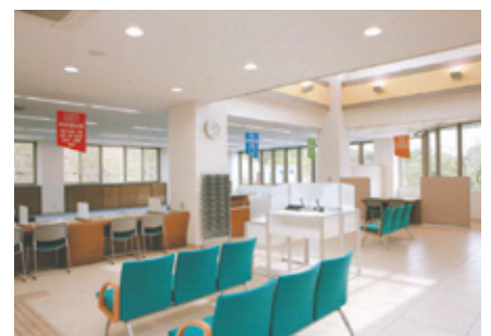
手続き・待合スペース