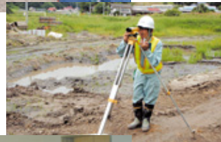
二本松工業高校 (4名)