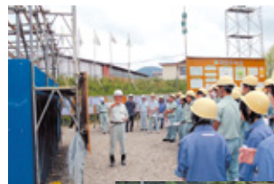
会津工業高校 建築インテリア科 (79名)