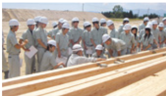
勿来工業高校 建築科(36名)

今年は6月15日にいわき市の県立勿来工業高校建築科の生徒36名が二本松市に建設中の東和小学校の現場を見学。7月3日には、会津若松市の会津工業高校建築インテリア科の生徒79名、9月2日～4日には二本松工業高校の生徒4名、9月3日には白沢中学校の生徒3名に、実際の工事現場を見学してもらい、仕事を通しての喜びや苦勞を体験してもらいました。次代を担う子供たちが、将来職業選択する際の一助にすることを目的に実施されている体験学習。参加した生徒からは「学校では体験できない仕事の喜び、厳しさ、難しさを実感して、大変貴重な体験ができました」など多くの感謝の言葉が寄せられました。