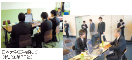
日本大学工学部にて(参加企業39社)