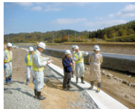
工事現場視察の様子

当日は、施工区間を参加者全員で視察し、工事の進捗状況の確認、第1回目のワークショップの内容確認や今後の河川環境と河川工事施工についての意見交換が行われました。