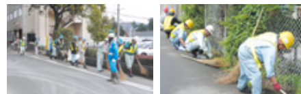
2月19日 福島県庁東分庁舎2号館周辺での美化活動の様子

また、7月5日には、当社施工の川俣町、川俣精機倉庫建設工事現場周辺で清掃奉仕作業が行われました。当日は当社社員、関係各社総勢14名が参加し、路肩や側溝付近の雑草を除去し、ほうきで綺麗に掃き掃除をしたほか、車道や歩道に棄てられたゴミを拾うなど熱心に取り組みました。