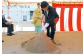
鎮入れをする当社社長