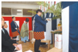
玉串奉奠をする当社社長