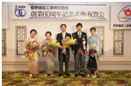
左から、会長夫人、創業者夫人、菅野会長、菅野社長とご家族