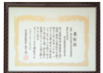
無災害工事表彰状