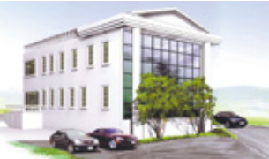
(株)トライエース研究棟完成イメージパース