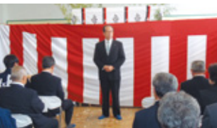
浅和定次村長様からのご挨拶