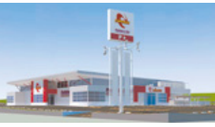
ニラク本宮店完成イメージパース