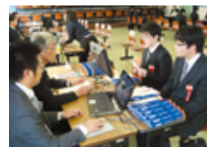
合同企業説明会の様子

就職難と言われる現在、社会に於ける建設業の役割や重要性についてPRし、積極的な人材の確保に取り組んでまいります。