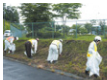
7月8日 中外化成周辺での活動の様子

当日は2班に分かれ、第1班は本社前から長屋神社までの約900mを、第2班は丸三木材・プレカットワークス前までの800mの区間の、道路沿いに捨てられた空き缶やペットボトル、紙くず、タバコの吸い殻などのゴミを分別しながら回収するなど熱心に取り組みました。