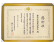
授与された感謝状

震災から早8ヶ月が過ぎましたが、福島県の復興は始まったばかりです。これからも福島県の復興に全力で協力してまいります。