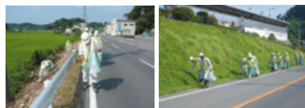
8月12日 第1班の活動の様子