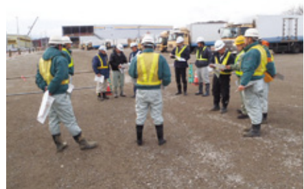
12月度の安全パトロールの様子

当社では毎月安全衛生パトロールを実施し、労働災害を未然に防ぐよう努めてまいります。