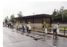
7月18日 医療法人落合会東北病院周辺

また、11月16日は本社及び郡山支店周辺の清掃を行い、地域環境美化のため汗を流しました。