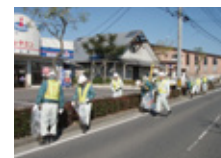
11月16日 郡山支店周辺