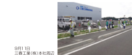
9月11日 三春工業(株)本社周辺