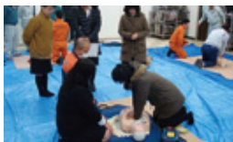
AED及び心肺蘇生訓練の様子