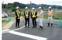
土木作業所での見学の様子

7月6日に採用試験が行われ、厳正な審査をした後、平成29年度4月からの採用者が決定する予定です。