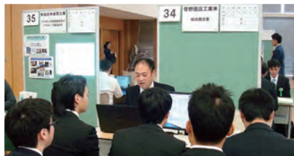
日本大学工学部就職セミナーの様子

3月18日、平成29年度3月卒業予定者を対象とした日本大学工学部就職セミナーが開かれました。当社のブースを訪れた11名の学生が熱心に説明を聞いていました。