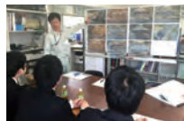
建築作業所での見学の様子