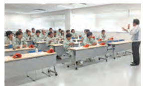
社外見学会の様子

当日は当社社員30名が見学会に参加し、熱心に説明を聞き、実際に車両の製造・組立の過程や工場の生産設備を見学しました。各々が学んだことを活かし、当社の更なる発展に尽力してくれる事を期待します。